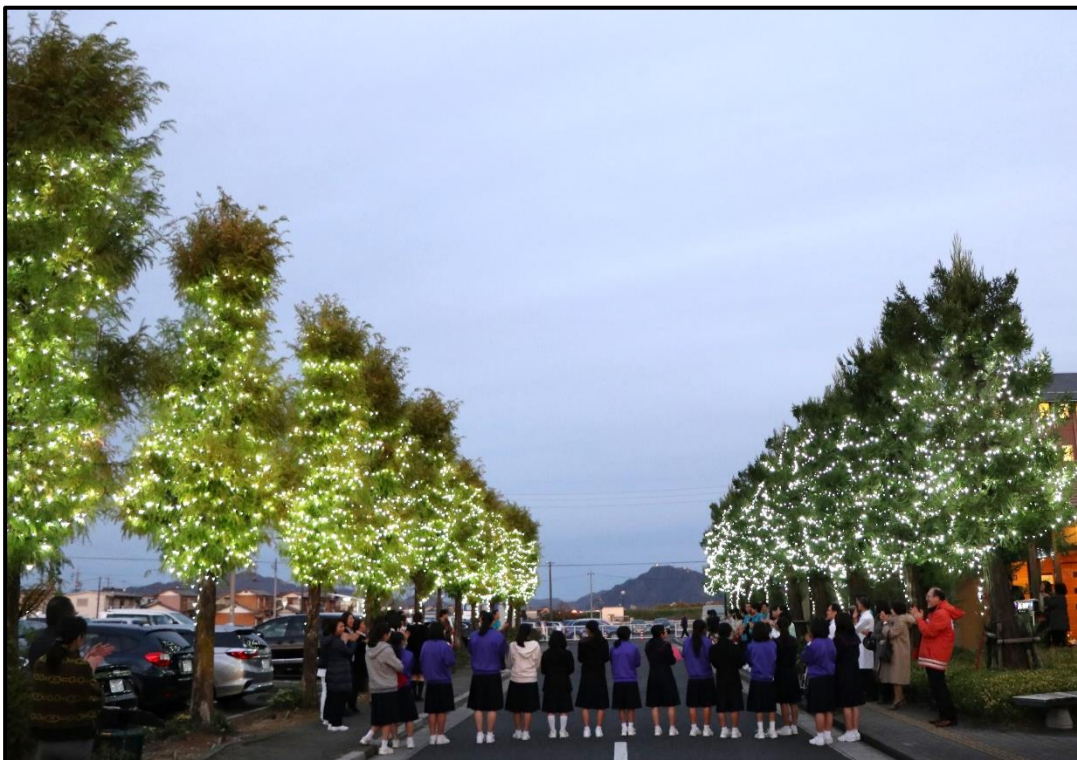
▲岐阜市立岐阜西中学校合唱部の皆さん